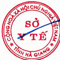
Lương Viết Thuận